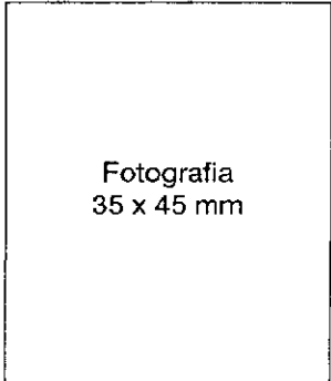
Fotografia 35 x 45 mm

Do wniosku załączam 2 fotografie oraz następujące dokumenty: