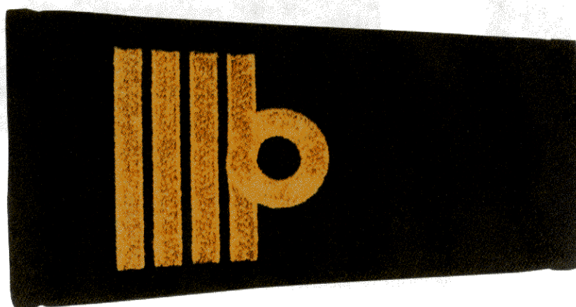
Dystynkcja do umundurowania wyjściowego marynarki wojennej