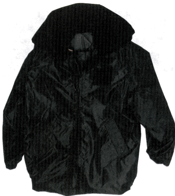
Kurtka zimowa nieprzemakalna koloru czarnego z podpinką