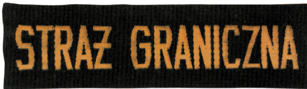
Otok koloru czarnego z napisem „STRAŻ GRANICZNA”