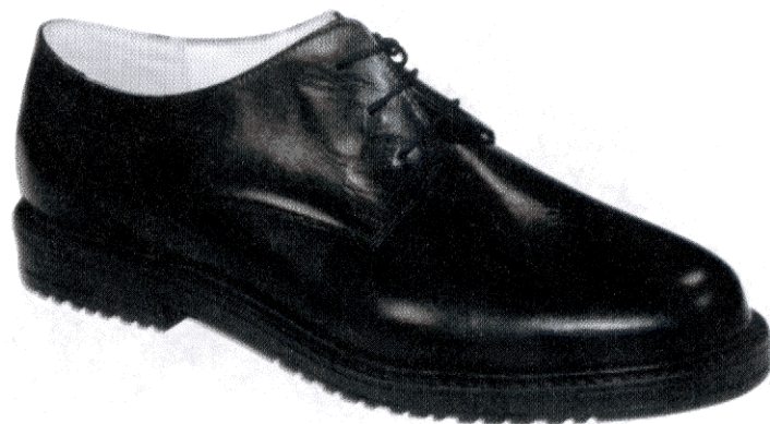
Półbuty koloru czarnego