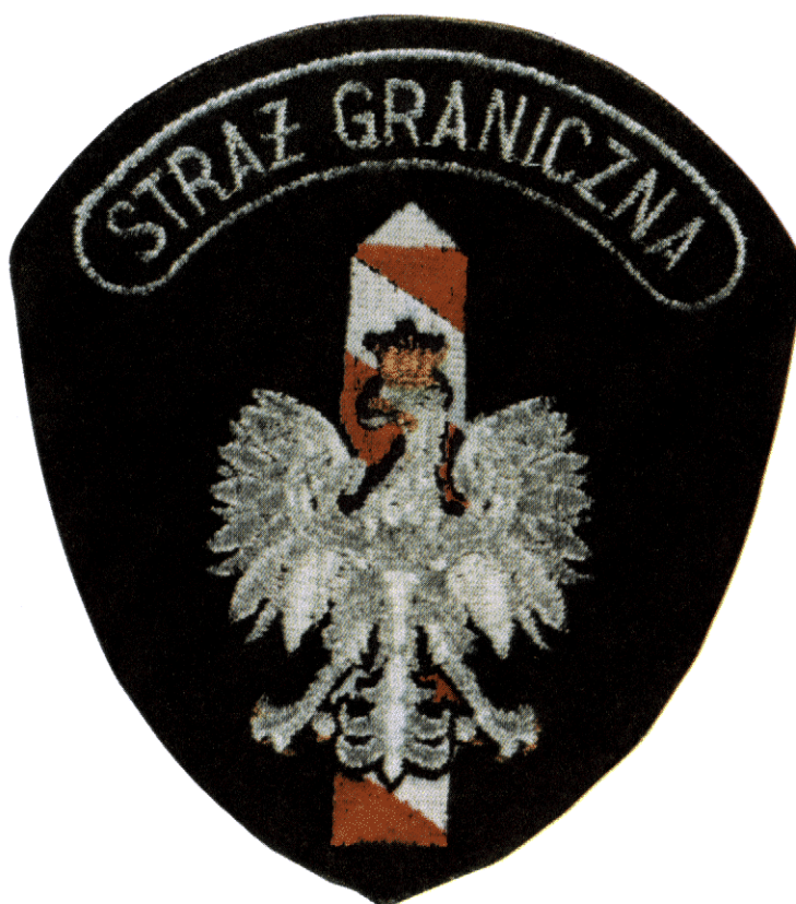
Oznaka „STRAŻ GRANICZNA” do umundurowania marynarki wojennej