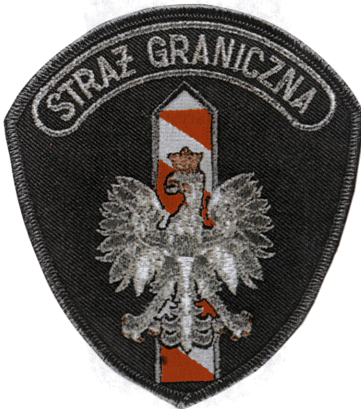
Oznaka „STRAŻ GRANICZNA” do umundurowania wojsk lotniczych