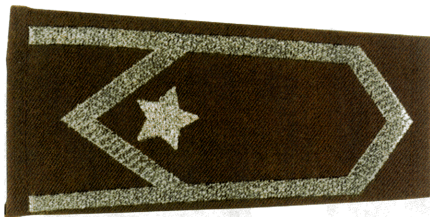
Dystynkcja do umundurowania wyjściowego wojsk lądowych