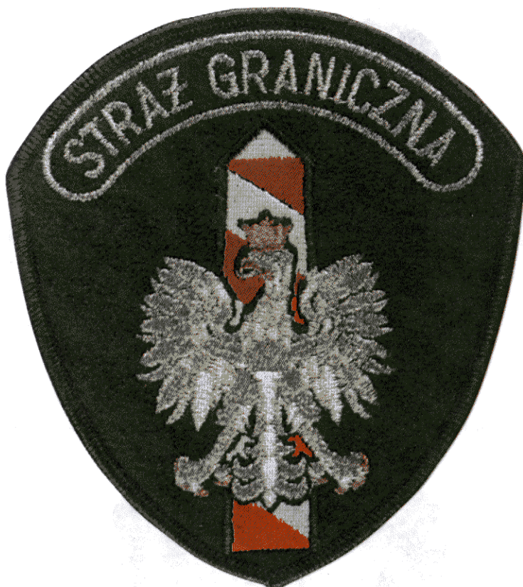
Oznaka „STRAŻ GRANICZNA” do umundurowania wojsk lądowych