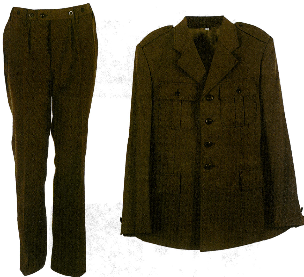
Mundur wyjściowy koloru khaki